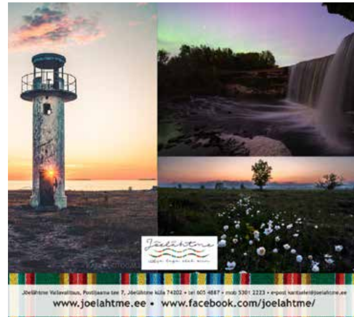
2024. aasta kalendrifoto konkursi võidupildid.

Kalendri detailid: triokalender; päis A4, jalus alt trükiga; päisel puuritud riputusauk; kuupäevamärkija; kalendaarium must-punane.