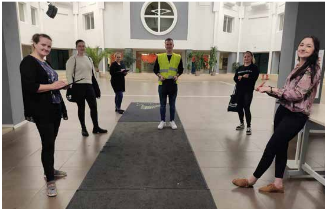
Noorsootöötajad helkurikontrolli patrullis Loo koolis.

Seejärel külastasid noorsootöötajad 6. novembril Loo kooli, kus kontrolliti koostöös huvijuhi ning kolme õpetajaga 506 kooli sisenevat õpilast (kaasa arvatud õpetajad), kel-