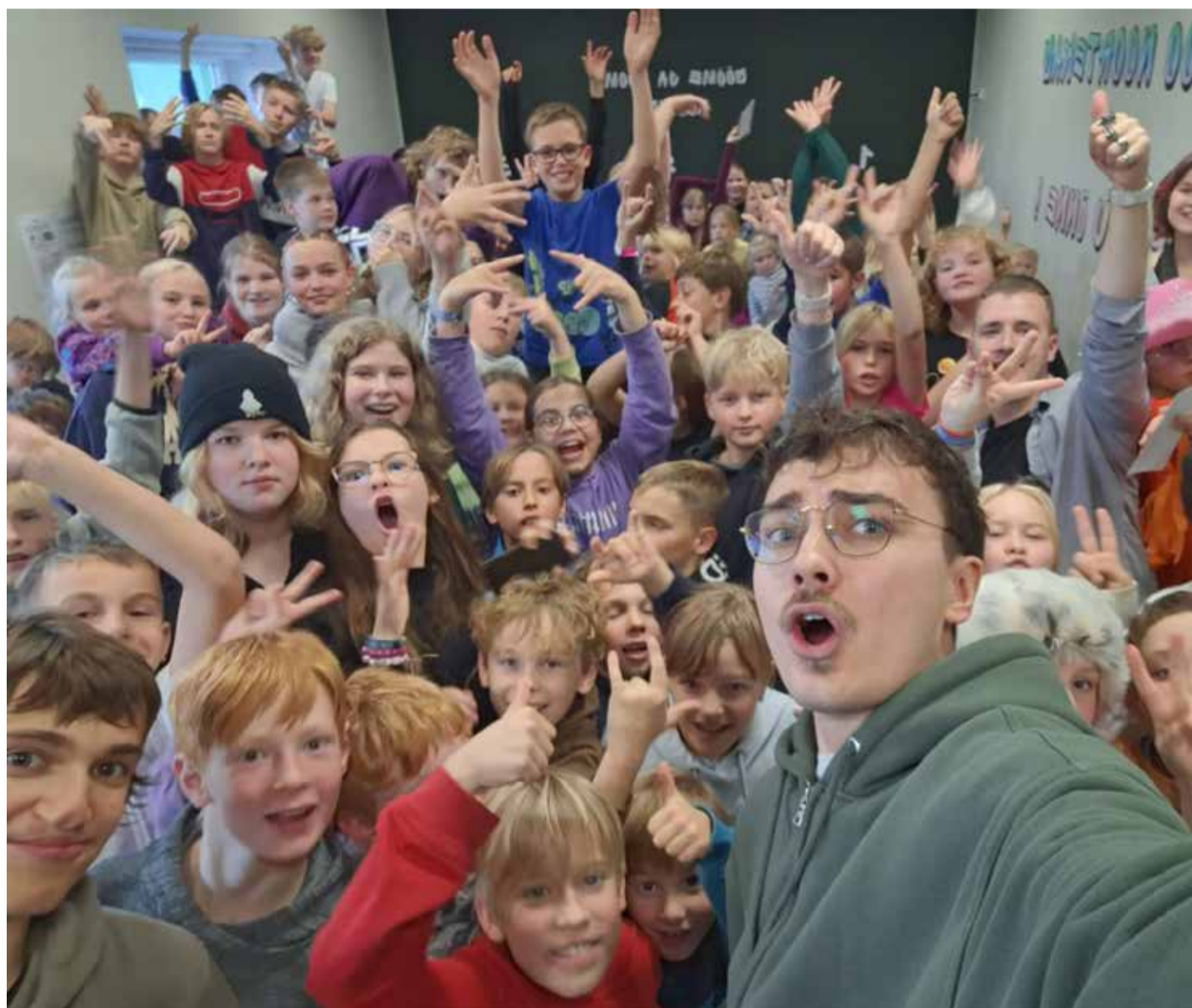
Loo noortekeskuse sünnipäevapidu.

koolipäevade lõpuni koolidesse noortega lauamänge mängima. •