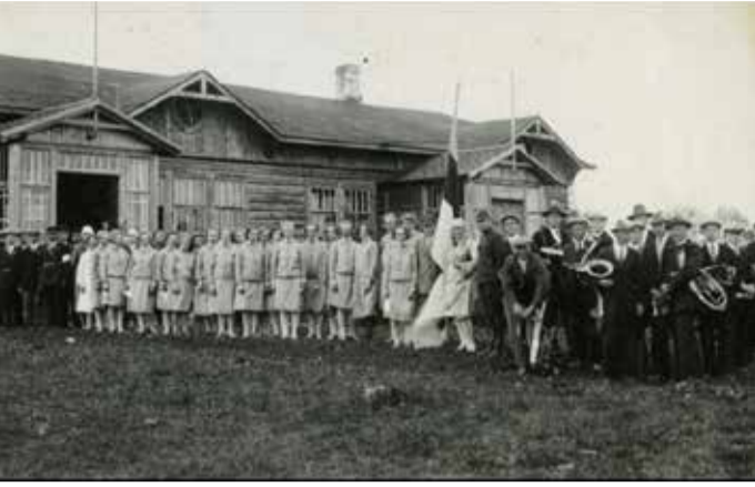
Naiskodukaitse Harju ringkonna Jõelähtme jaoskonna liikmed 1940. aastal Jõelähtme rahvamaja ees töötust andmas.